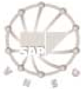
VNSG | SAP Gebruikersdagen 2001

Op 6 en 7 september vindt de 2001-uitgave van de SAP/VNSG Gebruikersdagen plaats, het evenement voor de 'SAP-wereld' in Nederland. Naast een uitgebreide conferentie (met presentaties van onafhankelijke analisten en market-watchers, van SAP, van SAP-klanten en van SAP-partners), is er een goed opgezet beursgedeelte waar veel praktische toepassingen worden getoond. De SAP/VNSG Gebruikersdagen is een 'must' voor elke SAP-gebruiker in Nederland. C/TAC-Align is als partner van SAP uiteraard goed vertegenwoordigd, met een uitgebreide stand op de expo en via presentaties in de conferentie.