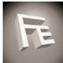
FABER ELECTRONICS BV